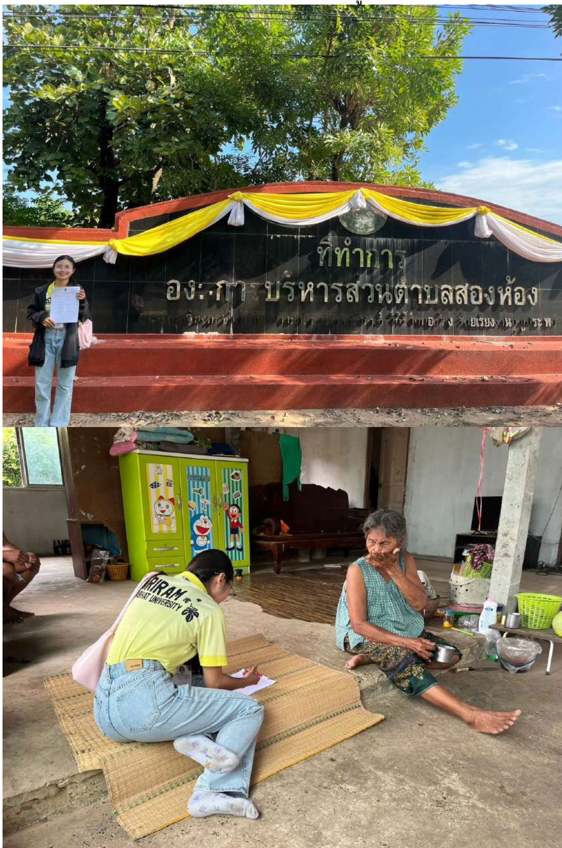
ภาพประกอบการสำรวจข้อมูล